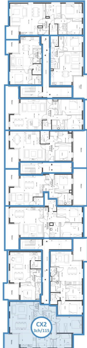
étages +1 à +6